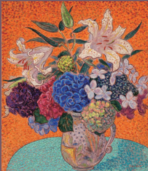
「山百合と紫陽花」 F10 油彩