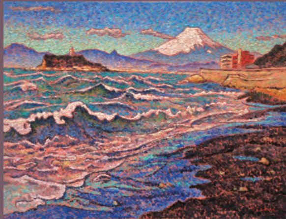
「稲村冬日」 P10 油彩

昨年20年振りでヴェネチアを再訪。その全く変わらない光景を前にした時、自分が悶々と悩み描いていた若き日々のがふと蘇り、タイムスリップした感覚に襲われ、涙が出た。人生という旅路の中で縁あって出会えた場所、それを今現在の自分がどのように感じ、見て、描けるのか…。 変わらないものの前に対峙し、変わってゆく自分の心を見つめる。風景を描く喜びはそういうところにあるのかもしれない。