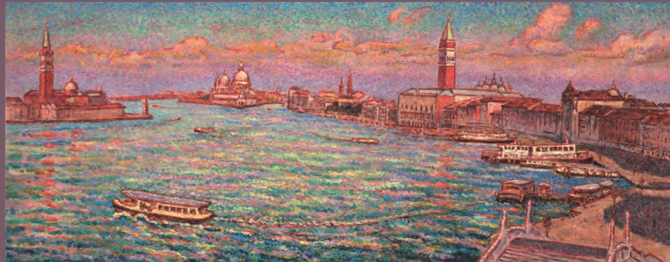
「ヴェネチア朝陽」 変50 (1167×450mm) 油彩

昨年20年振りでヴェネチアを再訪。その全く変わらない光景を前にした時、自分が悶々と悩み描いていた若き日々のがふと蘇り、タイムスリップした感覚に襲われ、涙が出た。人生という旅路の中で縁あって出会えた場所、それを今現在の自分がどのように感じ、見て、描けるのか…。 変わらないものの前に対峙し、変わってゆく自分の心を見つめる。風景を描く喜びはそういうところにあるのかもしれない。