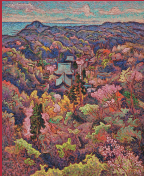
「勝上嶽の春 (北鎌倉)」 F 15 油彩