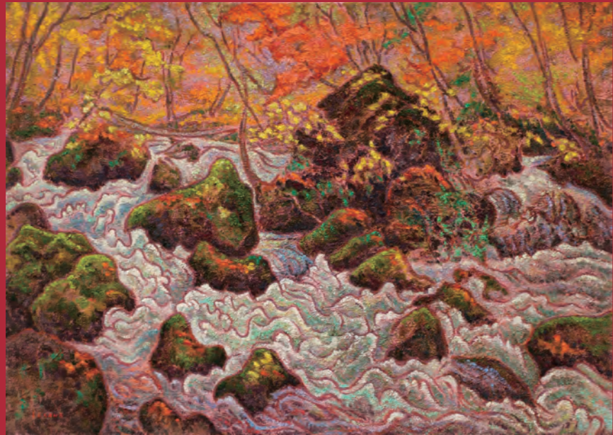
「奥入瀬 晩秋」 P 30 油彩