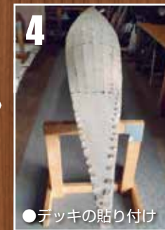
●デッキの貼り付け