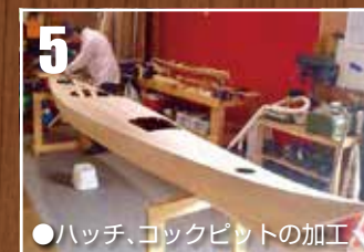
●ハッチ、コックピットの加工