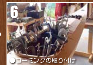
●コーミングの取り付け