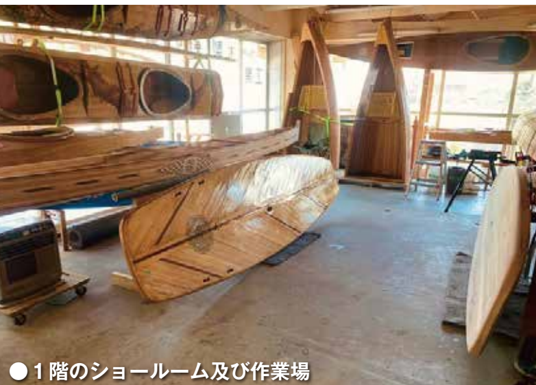
●1階のショールーム及び作業場