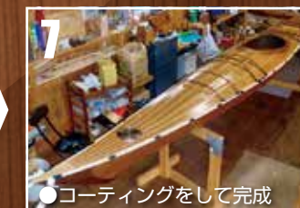
●コーティングをして完成