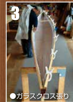
●ガラスクロス張り