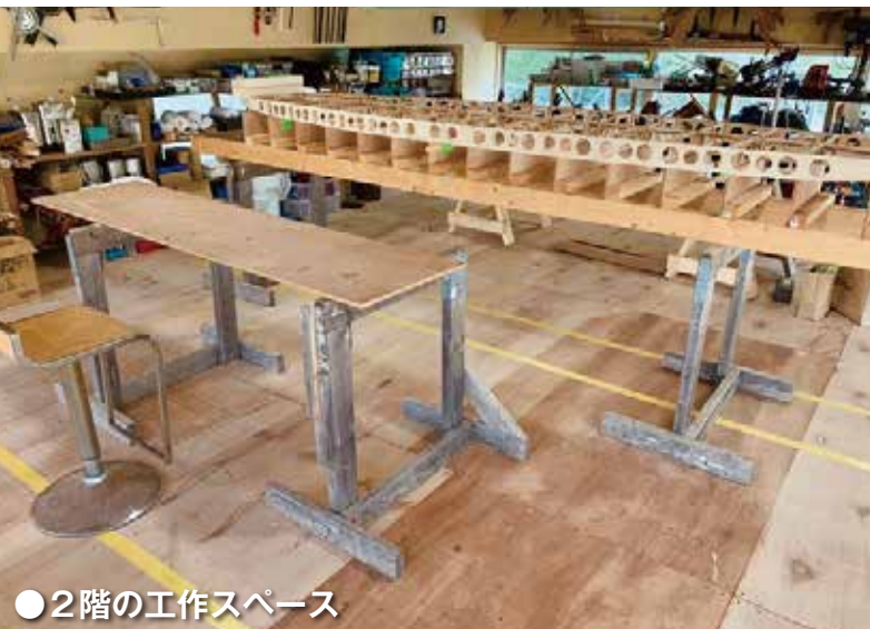
●2階の作業スペース