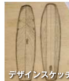
デザインスケッチ