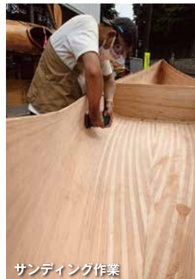
サンディング作業

世界にひとつしかない木製のシーカヤック、カヌーやSUPを造ることはとてもワクワクすることです。製作の過程で自分なりのアイデアを生かし、デザインやサイズをカスタマイズすることができます。完成した時の喜び、手作りの満足感は最高です。誇りや充実感も生まれます。木製のシーカヤック、カヌーやSUPは、メンテナンスがしやすく、長年にわたって使うことができます。長者ヶ崎海岸、大浜海岸、一色海岸に漕ぎ出すと、相模湾の先に伊豆半島、富士山が広がり、葉山の豊かな自然と一体となります。このような体験をして、より充実した自分時間を創ってみませんか。