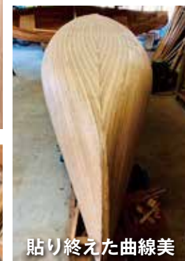
貼り終えた曲線美